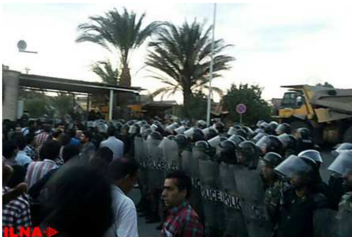
Iranian Labour News Agency