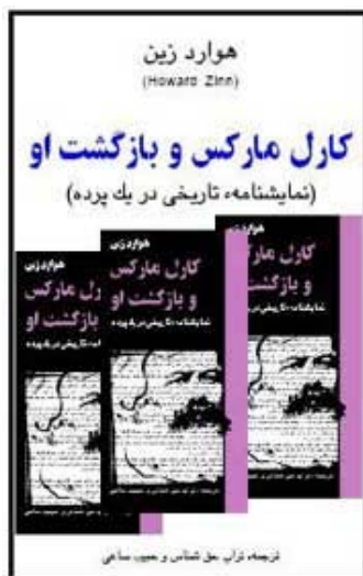
کارل مارکس و بازگشت او

علی لاریجانی، دبیر شورای امنیت رژیم روز جمعه ۲۸ آبان از امضای توافق نامه امنیتی میان جمهوری اسلامی و «موفق الربیعی» مشاور امنیت ملی عراق، خبر داد. بنا بر گفته وی «الربیعی» گفته است اگر «دادگاههای ایران حکمی علیه مجاهدین صادر کنند ممکن است عراق بر اساس قوانین بین المللی و توافقنامه های دو طرف، آنها را به ایران تحویل دهد.» این که الربیعی در سیاحتش بر سر سفره رنگارنگ تروریستها چه خوش و بشهایی کرده است و قول چه رهاوردهایی را گرفته است می توان حدس زد. اما این طور که آشکار است وی در این سیر و سیاحت زیاده گشاده دستی کرده تا جایی که آشکارا قوانین و قراردادهای بین المللی را زیر پا گذاشته است. وی دو سال پیش خواهان اخراج اعضای سازمان مجاهدین خلق از عراق شده بود که با محکومیت بین المللی نیروهای مدافع حقوق بشر در عراق و سراسر جهان مواجه شد. علاوه بر این که این موضع گیری علیه نیروهای اپوزیسیون یک رژیم دیکتاتور و حامی تروریسم در منطقه محکوم است اما نقش و رد پای جمهوری اسلامی در سیاست و رزان و دستیاران قدرت در عراق را نیز نشان می دهد. پایوران رژیم ولایت فقیه به دلیل نقض حقوق بشر، سرکوب مستمر کارگران و زحمتکشان، جوانان و زنان و نیز به دلیل قتل عام زندانیان سیاسی، قتلهای زنجیره ای که روشنفکران،