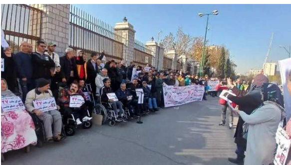
بقیه در صفحه ۳۰

* شماری از افراد دارای معلولیت مقابل ساختمان مجلس رژیم در تهران دست به تجمع زدند. به گزارش ایلنا، افراد دارای معلولیت، برای چندمین هفته متوالی، در اعتراض به عدم اجرای ماده ۲۷ قانون حمایت از حقوق معلولان و پیگیری مطالبات معیشتی خود تجمع کردند. بر اساس ماده ۲۷ این قانون، دولت موظف است کمک هزینه معیشت معلولان شدید و بسیار شدید فاقد شغل را حداقل برابر با دستمزد سالانه تعیین کند و اعتبارات آن را در بودجه کشور لحاظ کند.